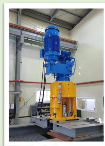
チタン PPS 攪拌機