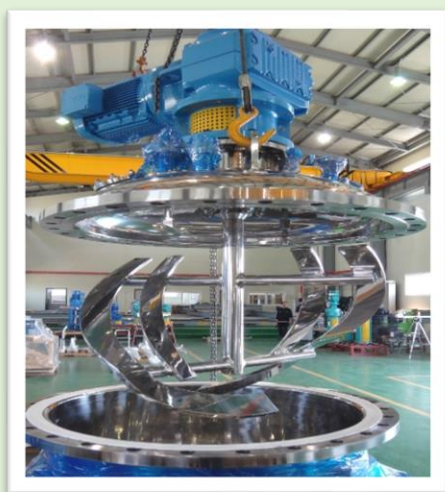
高粘度ポリマー攪拌