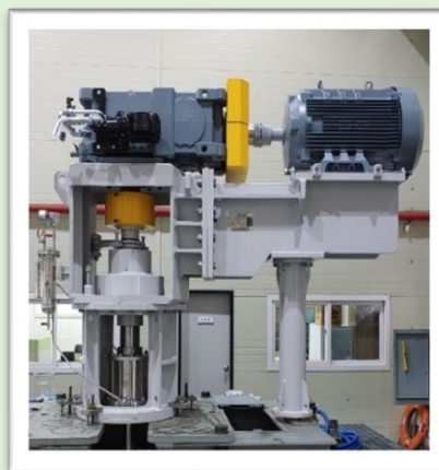
特殊用途リップシール